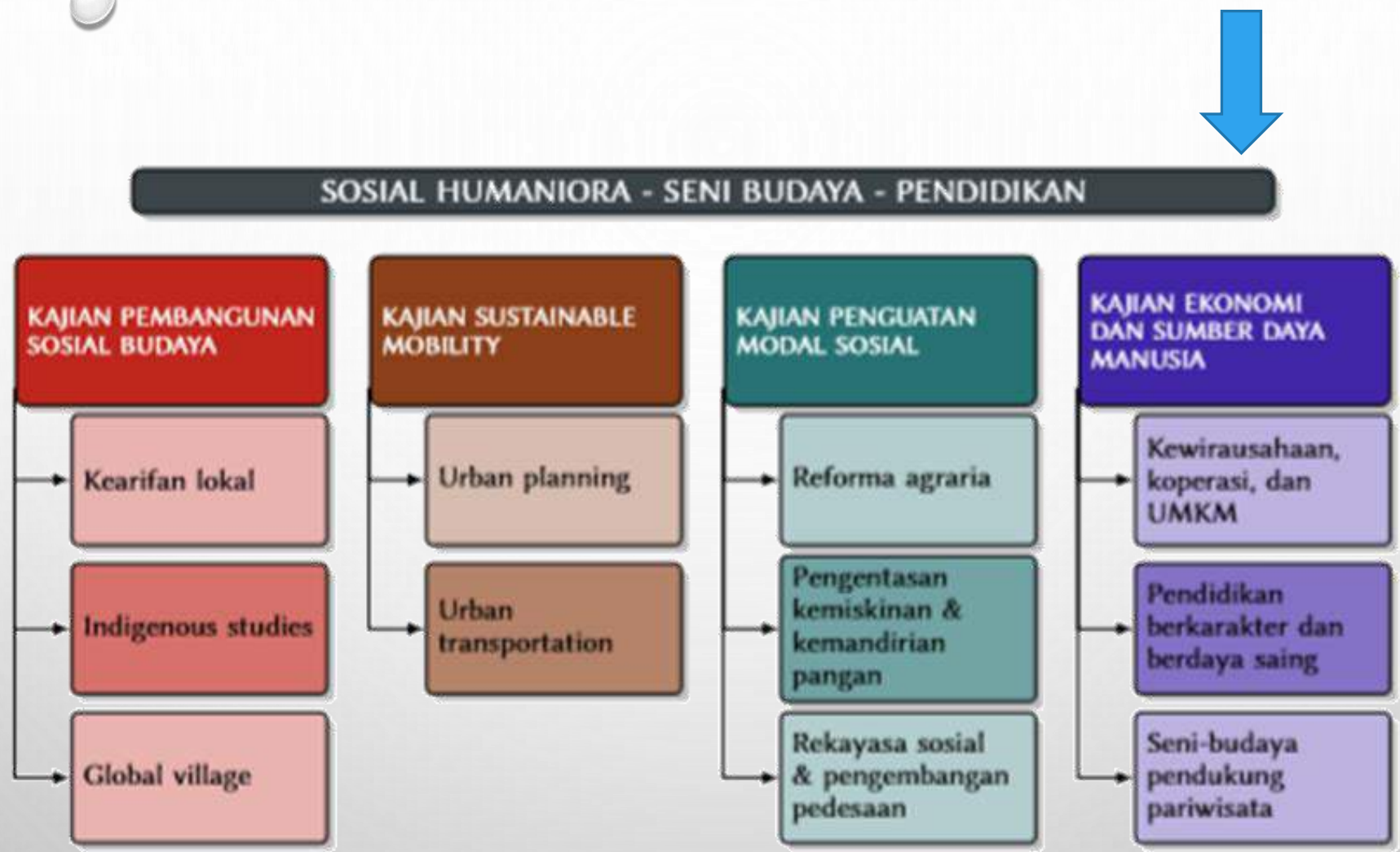
Gambar 4.12: Tema dan topik untuk fokus riset Sosial Humaniora - Seni Budaya - Pendidikan